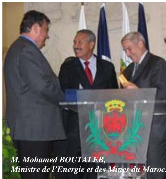
M. Mohamed BOUTALEB, Ministre de l'Energie et des Mines du Maroc.