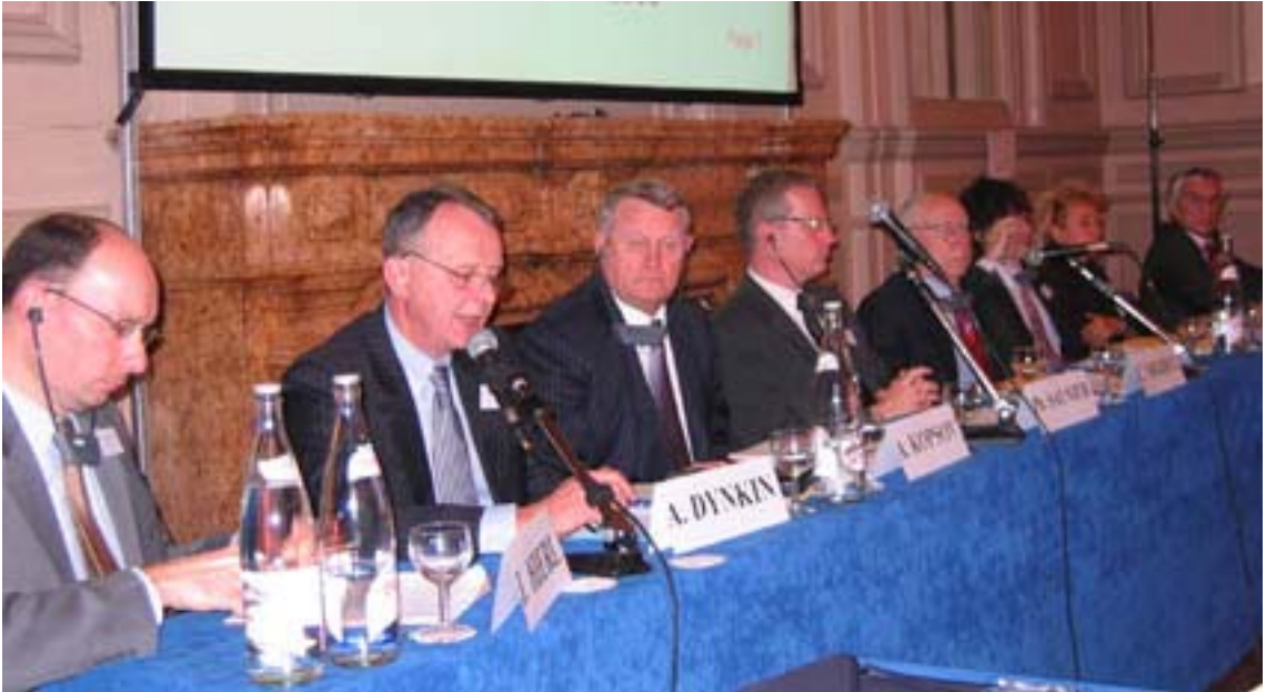
TABLE RONDE avec la participation de Mme et MM.:

« L'impact de la crise financière mondiale sur le secteur énergétique »